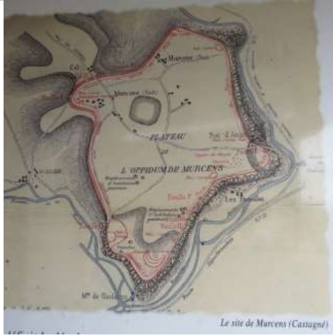
Le site de Mucens (Castagny)