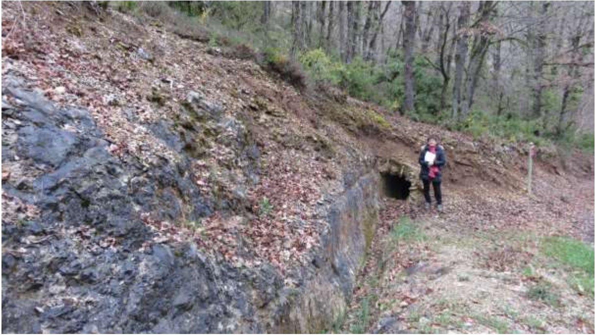
Vestiges de l'aqueduc